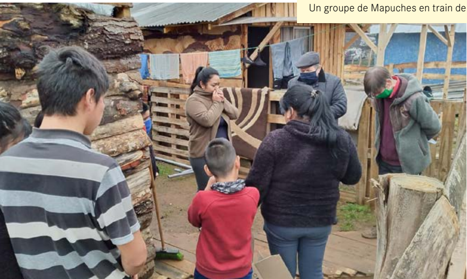
Un groupe de Mapuches en train de prier

Le sud du Chili est depuis des années le théâtre de violents conflits entre la population autochtone des Mapuches, les colons et l'État chilien. Comment les droits de propriété sont-ils réglés ? À qui appartient l'eau ? Les Mapuches sont souvent défavorisés dans ces domaines. L'équipe de psychologues, de théologiens, de juristes et de spécialistes de la culture du projet « Coopera » promeut auprès des différentes parties l'idée d'une société pacifique basée sur le respect mutuel. Elle offre un espace de dialogue, dispense des conseils juridiques aux Mapuches et assure un accompagnement professionnel aux personnes victimes de violences. Œuvrant de différentes manières à l'élaboration d'une paix fragile et parfois fugace, l'équipe souffre lorsque la violence resurgit. Pourtant, elle ne baisse jamais les bras et se réjouit chaque fois que la paix s'établit.