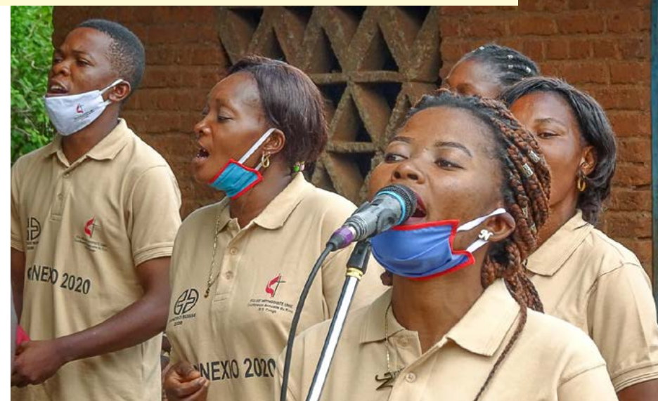
À travers leurs chants et leurs sketches, des femmes s'engagent en faveur de la paix

Le Congo est le quatrième plus grand État d'Afrique et pourrait aussi, au vu de ses importantes matières premières comme le cuivre et le cobalt, être l'un des pays les plus riches du continent. Mais l'instabilité et les conflits qui le minent ont entraîné une situation d'urgence humanitaire : plus de deux millions de personnes sont en fuite dans leur propre pays. Les femmes de la province du Sud-Kivu, qui ont elles-mêmes connu la souffrance et la violence, assument le rôle d'ambassadrices de la paix. À travers leurs chants et leurs sketches, elles attirent l'attention des gens sur des situations quotidiennes et se mobilisent, dans des églises et des lieux publics, pour promouvoir une coexistence pacifique et un esprit de tolérance entre les différentes ethnies.