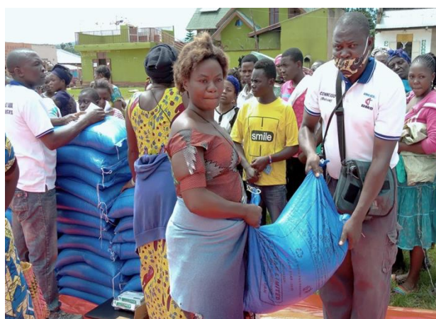
Chaque ménage reçoit une ration pour un mois lors de la distribution.

Symboliquement, ce dernier a aussi distribué quelques articles lui-même, et est resté jusqu'à la fin pour des raisons de sécurité.