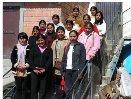
Des boursières qui ont terminé leurs formation avec succès. Elles sont prêtes de partager leurs savoir.