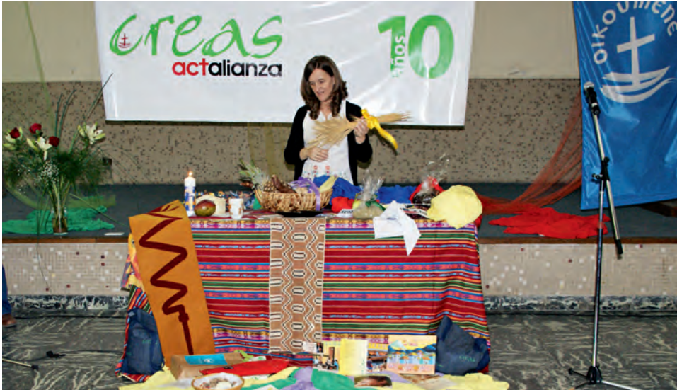
Die kirchliche Beratungsorganisation CREAS in Argentinien hat 2010 ihr 10-jähriges Bestehen gefeiert.