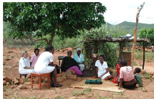
Une leçon en plein air. Le personnel soignant sensibilise la population à des thèmes tels que le HIV/SIDA.