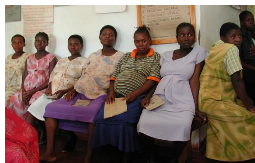
Pour assurer un meilleur suivi sanitaire aux mères et à leurs bébés, l'hôpital a ouvert en 2011 une école où les infirmières peuvent acquérir une formation complémentaire comme sages-femmes.