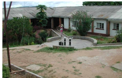
L'hôpital de Mutambara et son réseau de dispensaires dessert environ 120'000 personnes.

L'hôpital missionnaire de Mutambara fait partie de la station missionnaire de même nom, qui comprend également une école primaire, un lycée ainsi qu'un domaine agricole. Fondé en 1907, l'hôpital est situé en région rurale, à environ 100 km de la ville de Mutare. En tant qu'hôpital de district, il assure la couverture sanitaire de base de l'ensemble du district de Chimanimani et de la province du Manicaland (121'200 habitants). Il est également l'hôpital de référence pour 22 dispensaires et centres de santé villageois. L'hôpital dispose de 120 lits et offre les services suivants: services ambulatoires, chirurgie (surtout des césariennes; il faudrait un équipement d'anesthésie pour des interventions plus lourdes), obstétrique et gynécologie, soins de santé pour mères et enfants, HIV/SIDA (traitements à l'aide de médicaments anti-rétroviraux, soins palliatifs et soins à domicile), clinique ophtalmologique, laboratoire, médecine générale et pédiatrie et enfin cours de santé de base.