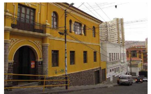
Das Institut befindet sich mitten in der Hauptstadt in La Paz.