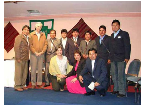
Diplomfeier von Studentinnen und Studenten am ISEAT