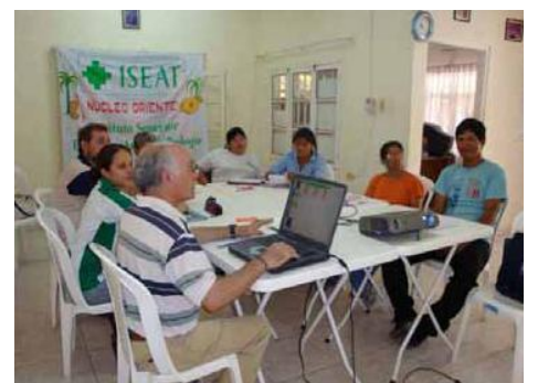
Studenten am ISEAT