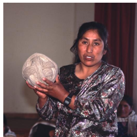
Wie präsentiere ich mein Können? Präsentations- und Moderationsworkshops runden das Programm der Promotoras ab.