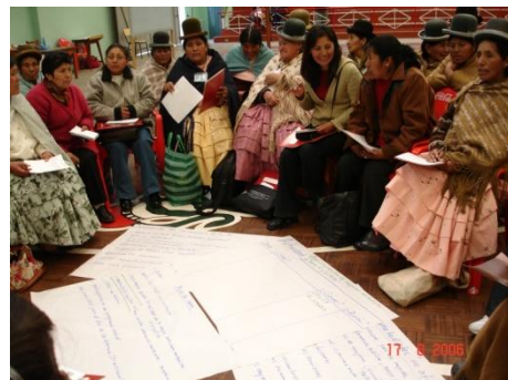
Ein Workshop dient auch dem Austausch unter Frauen, die hunderte von Kilometer fahren, um an diesen Treffen teilzunehmen.