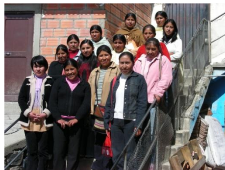
Erfolgreiche Stipendiatinnen sind bereit, ihr Können an anderen Frauen in ihren Dörfern weiterzugeben.

„Wir verpflichten uns, von andern zu lernen, uns beständig weiterzubilden und die Furcht zu verlieren, die Stimme zu erheben. Wir verpflichten uns, ein gutes Zeugnis zu geben, zu lächeln und zu korrigieren wo es nötig ist und neue Führungspersönlichkeiten zu sein, die den Veränderungsprozess unterstützen, in welchem unser Volk lebt.“