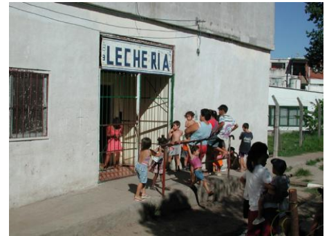
Regler Betrieb am Haupteingang der Lechería, eine Oase im Armenviertel „XY“ von Buenos Aires.

Je länger je mehr soll die Bevölkerung im Armenviertel in die Arbeit mit einbezogen werden. So wird von den Jugendlichen, die von den Angeboten der "Lechería" profitieren, erwartet, dass sie jede Woche auch etwas zur Arbeit beitragen. Sie können im Haushalt mithelfen oder ein Kinderfest für die Kleineren vorbereiten. Es kostet das Leitungsteam aber oft viel Geduld und Energie, diese Forderung nach Mitverantwortung durchzusetzen.