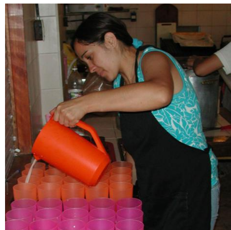
Eine täglich warme Milch gehört immernoch zum Grundangebot der Lechería für die Kinder.

Finanziert wird die Arbeit unter anderem von der politischen Gemeinde San Pablo in Buenos Aires, von der Caritas der Diözese von San Isidro und von Connexio, dem Netzwerk für Mission und Diakonie der Evangelisch-methodistischen Kirche Schweiz-Frankreich. Das Projektbudget für die Unterstützung von Strassenkindern beträgt CHF 35'000.