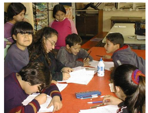
Kinder profitieren von ausgebildete PädagogInnen bei der Aufgabenhilfe.