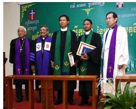
Bischöfe von Partnerkirchen zusammen mit zwei frisch ordinierten kambodschanischen Ältesten.

UEEMF – Connexio Mme Pascale Meyer 7, rue de l'Avenir F-67800 Bischheim