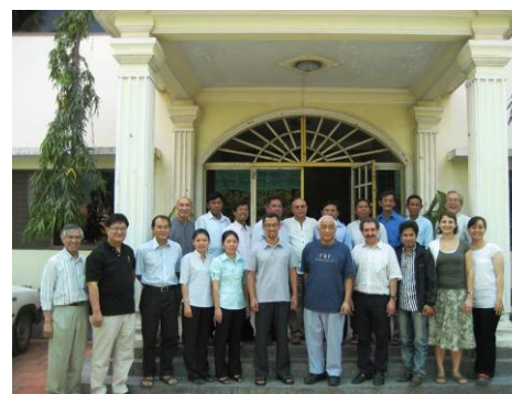
Das Implementation Committee trifft sich zweimal pro Jahr zur Planung der Kirchenentwicklung.