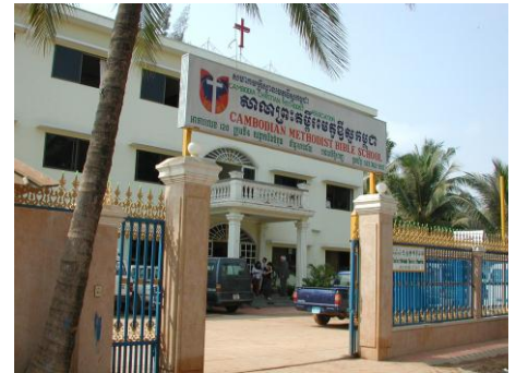
An der Bibelschule der Methodisten in Phnom Penh werden künftige Gemeindeleitende ausgebildet.

Heute gibt es rund 150 Gemeinden, die mit kambodschanischen Pfarrerinnen und Pfarrern oder Laienpredigern besetzt sind. Es sind also mehrheitlich Kambodschaner, die ihre eigenen Landsleute evangelisieren. Die Missionswerke unterstützen diese Mitarbeitenden mit Ausbildungs- und Schulungsangeboten. Für die Finanzierung der lokalen Arbeit sind die kambodschanischen Gemeinden selber ver-