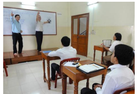
Kambodschanische Lehrpersonen und Mitarbeitende aus den Partnerkirchen unterrichten gemeinsam an der Bibelschule.