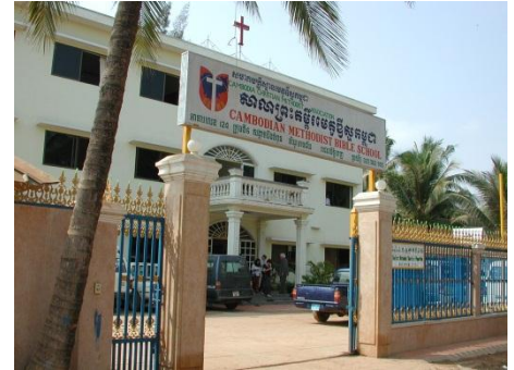
Les futurs responsables des églises locales sont formés à l'Ecole biblique méthodiste de Phnom Penh

Il y a aujourd'hui quelque 150 églises locales, desservies par une pasteure, un pasteur ou un prédicateur laïque cambodgien. Ce sont donc en majorité des Cambodgiens qui évangélisent leurs compatriotes. Les œuvres missionnaires soutiennent ces collaborateurs par des programmes de formation de base et de formation continue. Les églises locales cambodgiennes sont responsables du financement de leurs activités locales. Elles dépendent par contre de l'assistance étrangère quand il s'agit d'indemniser les membres du corps pastoral ou encore d'acheter du terrain et de construire des chapelles.