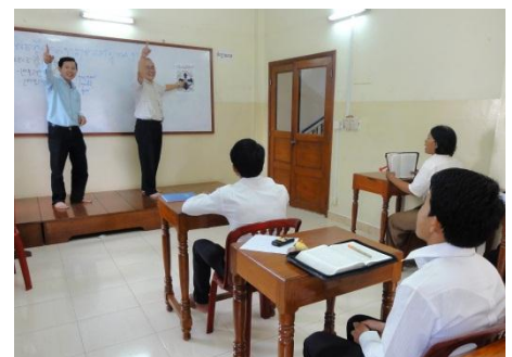
L'enseignement est assuré conjointement par des professeurs cambodgiens et des collaborateurs des Eglises partenaires