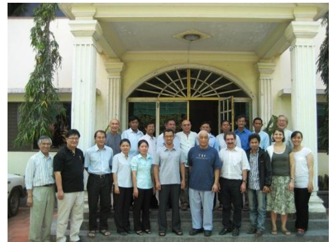
Le comité de mise en oeuvre se réunit deux fois par an pour planifier le développement de l'Eglise.