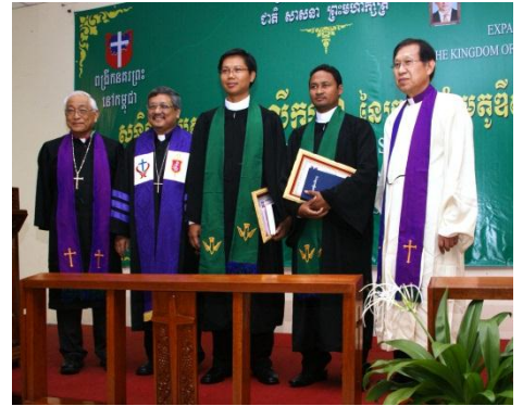
Evêques des Eglises partenaires et deux pasteurs-anciens cambodgiens récemment ordonnés.