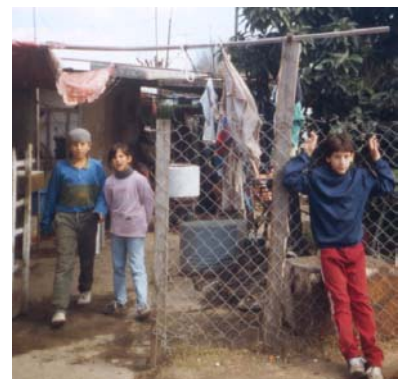
Armenviertel in Buenos Aires

Argentinien ist etwa 67mal grösser als die Schweiz und hat rund 38.4 Millionen Einwohner. Die jüngste Geschichte Argentiniens wird aufgearbeitet. Das argentinische Abgeordnetenhaus erklärt im August 2003 die Amnestiegesetz für Menschenrechtsverletzungen während der Militärdiktatur (1976-83) für nichtig. So wird die Möglichkeit eröffnet, gegen rund 2600 ehemalige Mitglieder der argentin. Streitkräfte gerichtlich vorzugehen. Während der Militärdiktatur wurden rund 30'000 Menschen entführt und ermordet. Auf der wirtschaftlichen Seite erholt sich die Volkswirtschaft im 2003 von der schweren Wirtschaftskrise (Zahlungsunfähigkeit im Dezember 2001), bei der bis 50% der Argentinier arbeitslos werden. Der Aufschwung erfasst nahezu alle Bereiche; die grösste Zuwachsrate mit 16% verzeichnet die Agroindustrie. Die Regierung unter Präsident Néstor Carlos Kirchner, seit 2003 im Amt, kündigt an, Teile der in den 1990er Jahren erfolgreich privatisierten Energieunternehmen aufgrund einer Energiekrise im 2004 wieder zur verstaatlichen.