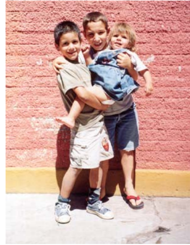
Spielende Kinder im Nicolas Lowe

Die Mitarbeiterinnen und Mitarbeiter möchten den Kindern über längere Zeit Bezugspersonen sein und ihnen Halt, Sicherheit und Geborgenheit geben. Dadurch ist es möglich, dass Kinder aus schwierigen Verhältnissen ein geordnetes Leben führen können und sich später wieder in ihrer Umgebung oder Familie zurechtfinden.